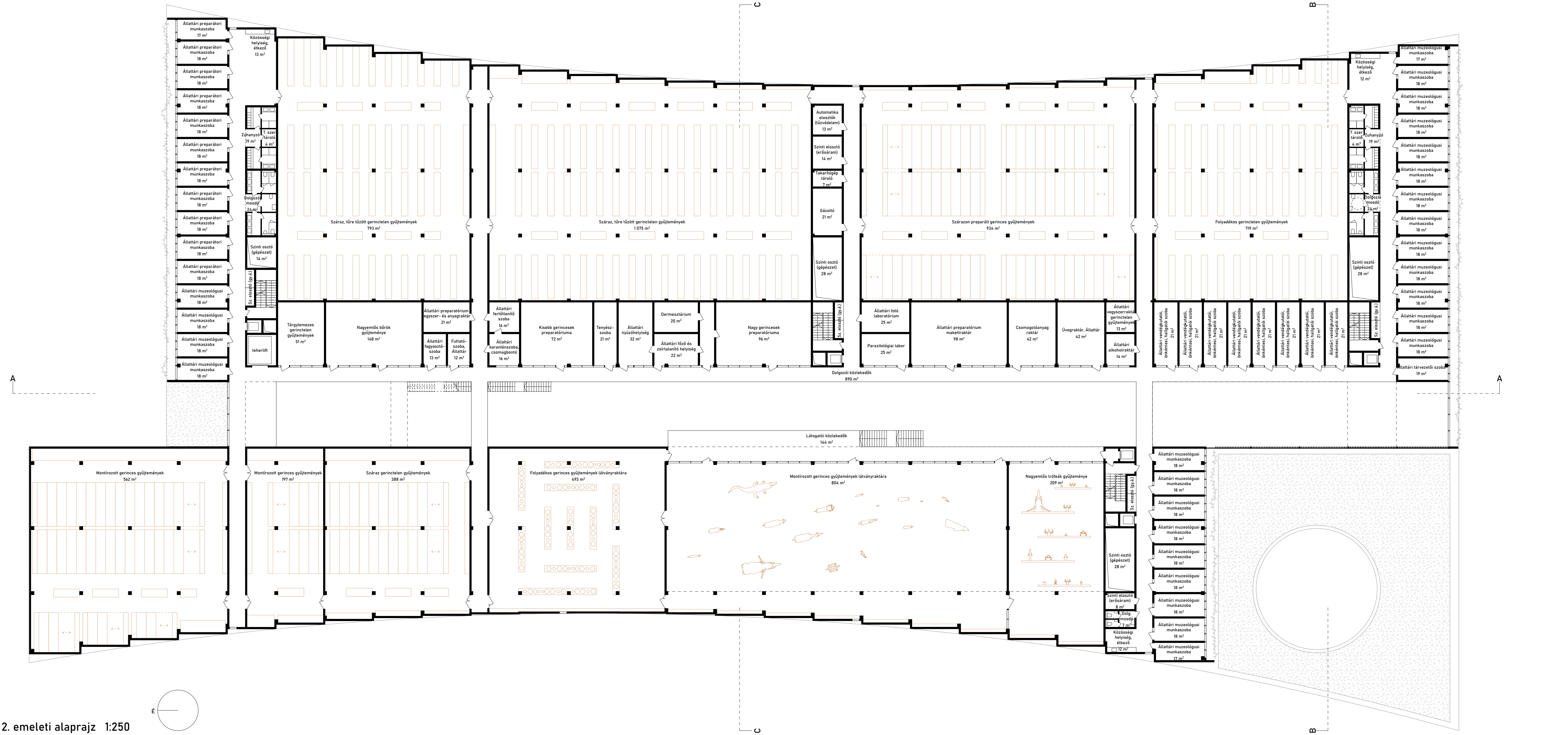
2. emeleti alaprajz 1:250